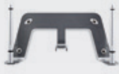
Kit für Wandmontage S30853-H4030-R101